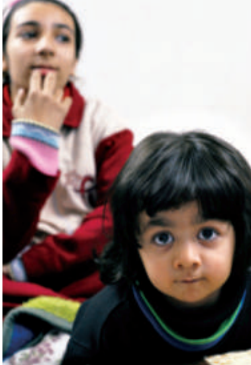
◀ Sorelle irachene nella loro casa di Amman, Giordania.