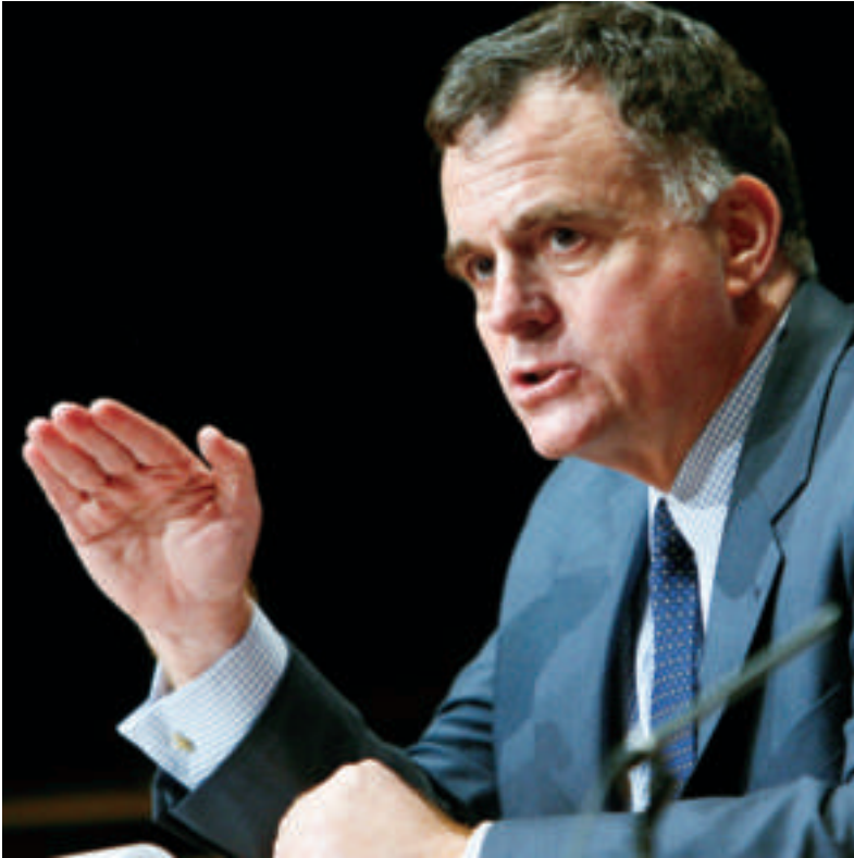
▲ Jordan Ryan, Vice amministratore del Programma delle Nazioni Unite per lo sviluppo e Direttore dell'Ufficio delle Nazioni Unite per la prevenzione e la ricostruzione nelle crisi: "La violenza di genere è uno degli ostacoli principali per la realizzazione dei diritti economici delle donne all'interno delle mura domestiche e fuori da esse".