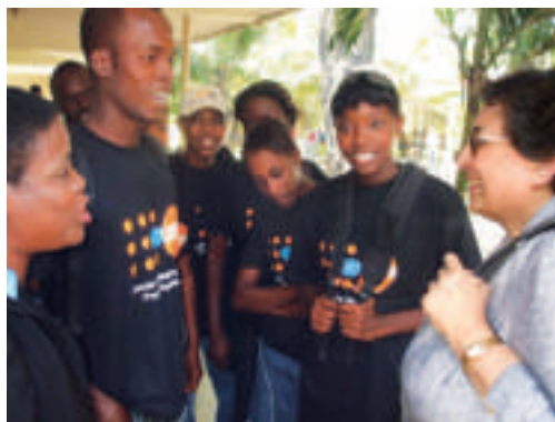
◀ Port-au-Prince. La Direttrice esecutiva dell'UNFPA incontra giovani haitiani del Gheskio Centre che prendono nota dei casi di denutrizione tra donne e bambini, marzo 2010.

Dal rapporto di continuità tra sviluppo e crisi e viceversa emerge con chiarezza come tutti gli investimenti fatti nell'ottica di promozione dello sviluppo attenuano l'impatto delle crisi e delle catastrofi naturali. Tale rapporto diventa ancor più evidente se si confrontano le diverse conseguenze di due recenti e violentissimi terremoti: quello di Haiti e quello del Cile. È vero