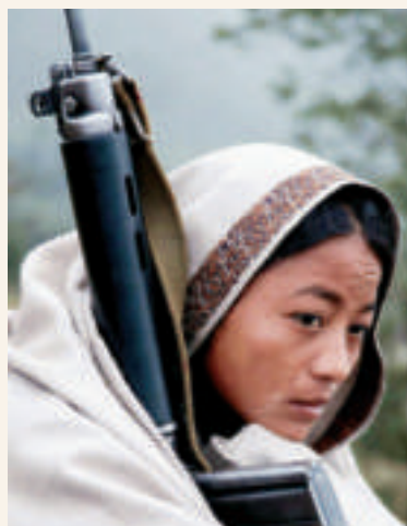
Bhojpur, Nepal, 2005. Una militante maoista.