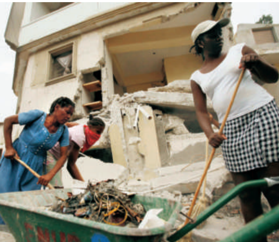
▲ Port-au-Prince. Haitiane sgombrano riufiuti e detriti dalle strade, nell'ambito di uno dei programmi "cash for work" dell'UNPD nel Carrefour Feuille.

familiari haitiani ci sono donne, estremamente vulnerabili in caso di emergenza, perché i padri sono spesso assenti e lasciano alle donne il compito di provvedere ai bambini. Sole con i figli nei campi sovraffollati che si estendono per molti ettari di terreno fangoso, non è facile per loro trovare fonti di reddito e la protezione della polizia è pressoché inesistente. Benoît si è però dichiarata fiduciosa. La situazione cambierà, dice: "Le donne nei campi dovranno organizzarsi – e lo faranno", ha dichiarato alla fine di aprile. "Prima di tutto vengono le necessità di cibo e salute... dobbiamo lasciare che la polvere si depositi". Nel frattempo il SOFA e altre organizzazioni hanno iniziato a documentare casi di violenza di genere verificatisi nei campi e ad offrire alle vittime servizi medici nelle loro cliniche. Le speranze si appuntano anche sulle unità esclusivamente femminili delle Nazioni Unite inviate da Bangladesh e India: ci si augura che possano migliorare il livello di sicurezza ambientale in alcuni dei campi in cui hanno trovato rifugio i terremotati.