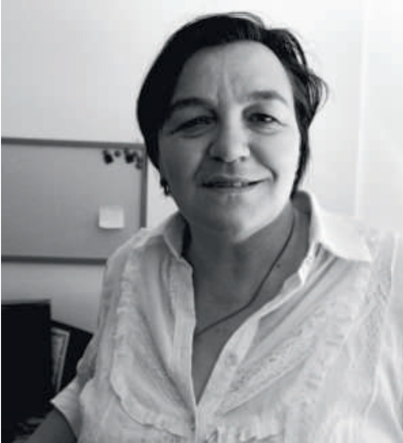
▲ Saliha Đuderija, viceministra per i Diritti umani e i rifugiati della Bosnia ed Erzegovina, dichiara che la questione dei risarcimenti alle donne vittime di abusi non ha ricevuto l'attenzione che meritava da parte degli organismi preposti.

coterapeute più in vista della Bosnia, medico dell'Ospedale universitario nazionale di Sarajevo. In un'intervista ha confessato che, vedendo i giovani travolti dagli stessi cruenti odi razziali della generazione precedente, teme per il futuro del paese, non ancora emerso del tutto dai traumi degli anni novanta.