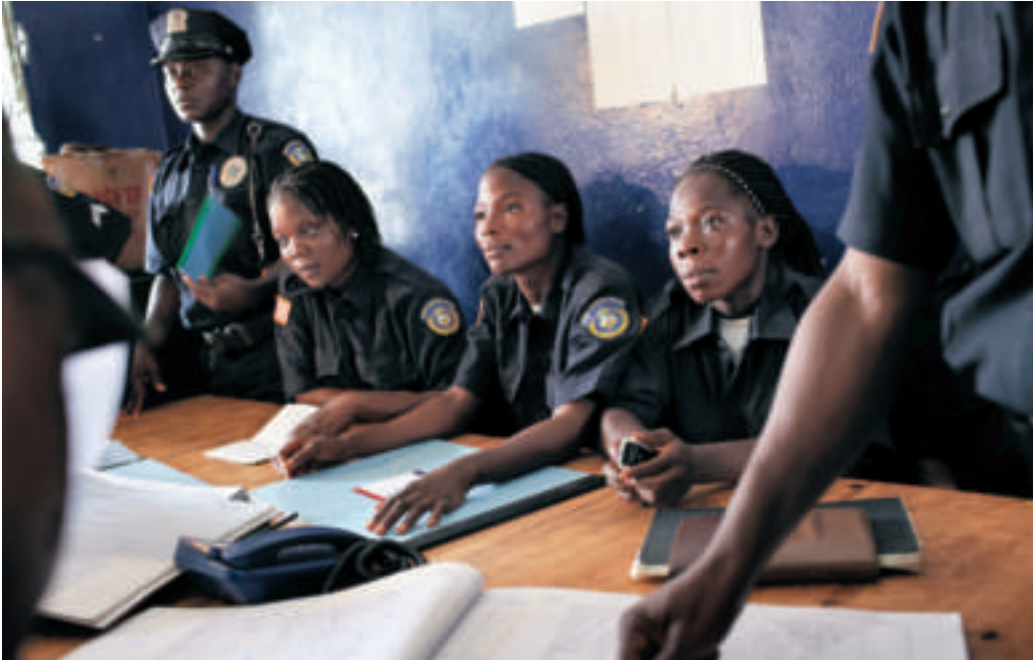
◀ Monrovia, Liberia. Donne poliziotto alla stazione di polizia Salem controllano le statistiche sulla criminalità.