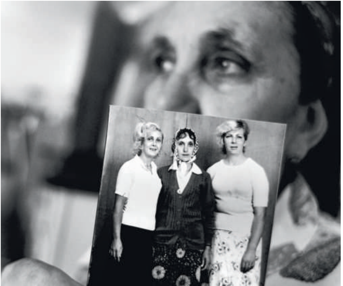
▲ Una vittima sopravvissuta alla guerra in Bosnia ed Erzegovina racconta le vicissitudini sue e della sua famiglia.

ganizzazione di vittime, ma poi ha capito che era estremamente complicato. “Alle donne non interessa organizzarsi, lottare”, fa notare. “Sono isolate e povere. Vogliono sapere se c’è qualcosa da guadagnare. Hanno paura che le loro famiglie vengano molestate”. Quest’analisi dura e brutale viene da una donna che ha perso la casa, la salute, il marito e la cui domanda di