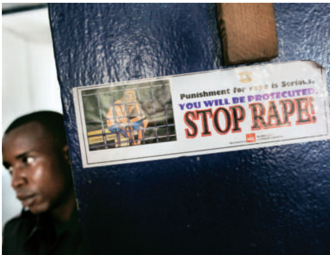
Monrovia. La stazione Salem della polizia liberiana, dove le donne costituiscono il 25 per cento dell'organico.