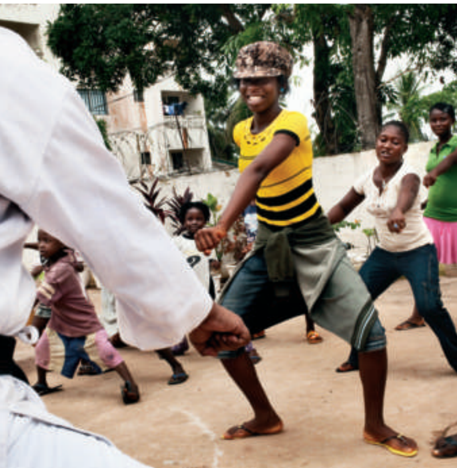
▲ Monrovia. Donne poliziotto insegnano autodifesa alle giovani liberiane.

che fosse approvata la risoluzione 1325, il Mano River Women's Peace Network aveva raccolto attiviste di diverse nazioni dell'Africa Occidentale: Guinea, Liberia e Sierra Leone che insieme hanno iniziato a lavorare per riportare la pace in tutta la regione. La rete del Mano River, a cui è stato assegnato nel 2003 il premio per i diritti umani istituito dalle Nazioni Unite, nel 2009 ha combattuto in prima linea contro il governo della Guinea per i fatti accaduti nel settembre di quell'anno: nello stadio di Conakry, la capitale, dov'era in corso un raduno dell'opposizione politica al regime, un ufficiale militare aveva dato ordine ai soldati di aprire il fuoco. Nel caos di quell'aggressione mortale, molte donne erano state catturate e violentate.